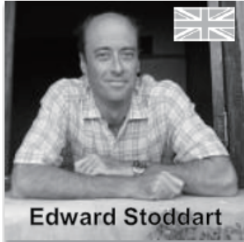
Alchemist Finisher フィニシングの錬金術師