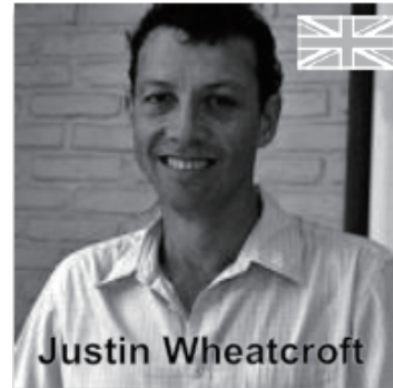
Wisdom of Woodsman 森の賢者